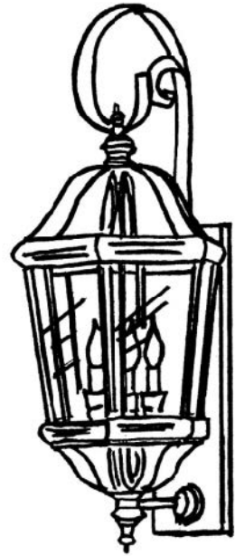
Drawing 1 - Strap Detail